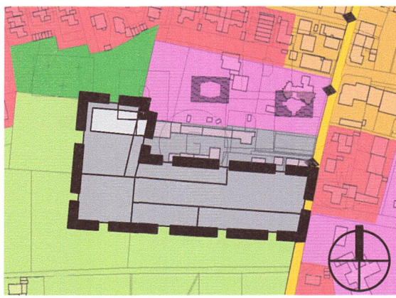
Änderung von einer Fläche für die Landwirtschaft in Gewerbliche Baufläche