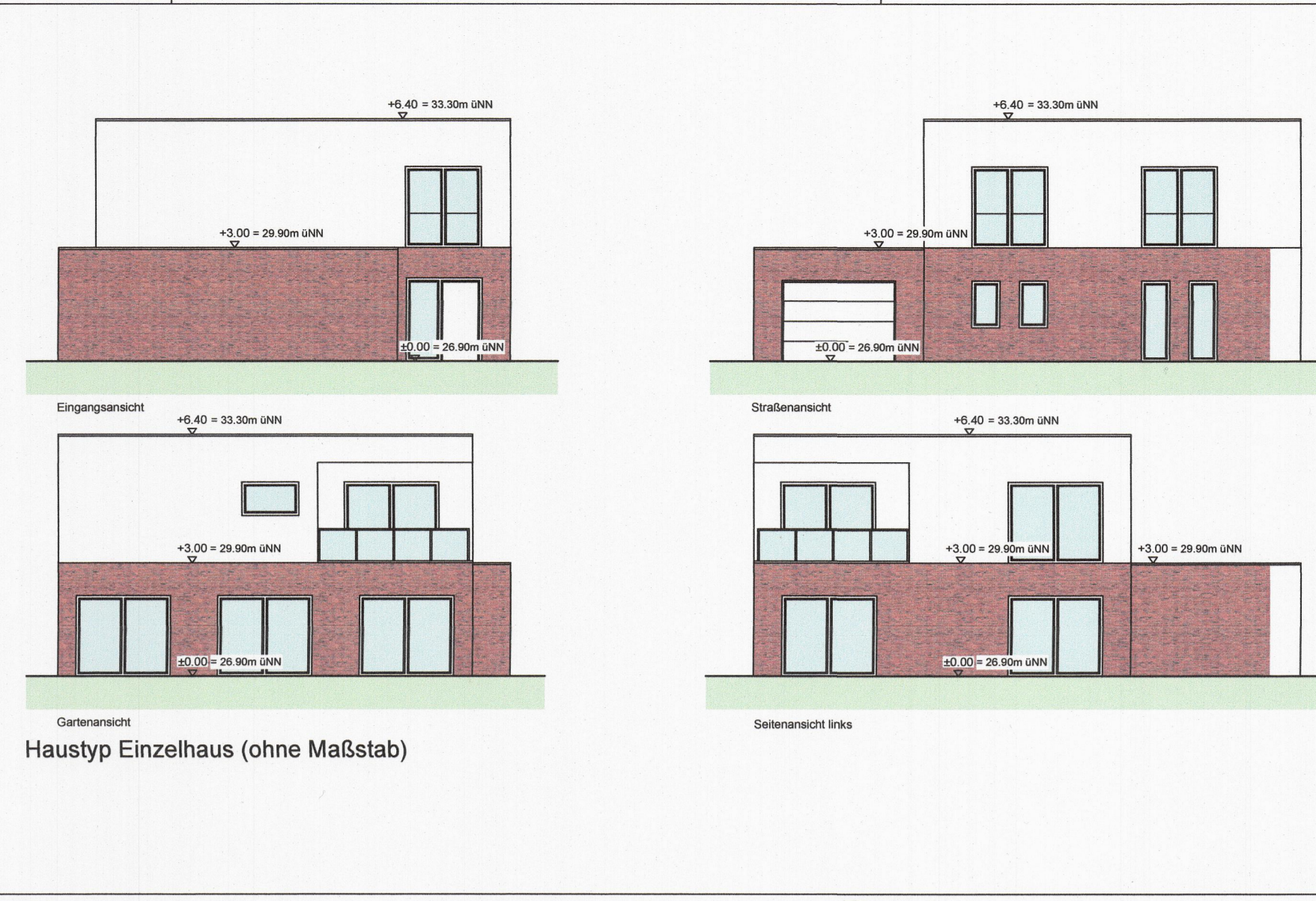
Haustyp Einzelhaus (ohne Maßstab)